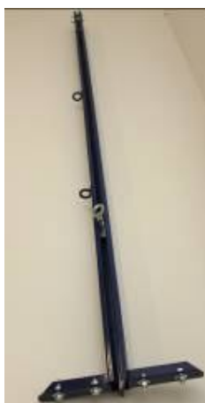
01 Viga do Orbitador dividida em duas partes (com trilho e carrinho);