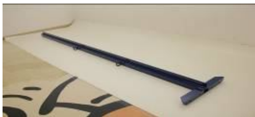
01 Viga do Vestibulador dividida em duas partes (com argolas);