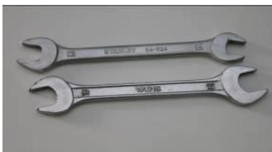
Ferramentas a serem utilizadas: chaves de boca 14 / 15 e 18 / 19 – não fornecidas

16 parafusos e buchas M12 para fixação do equipamento no chão.