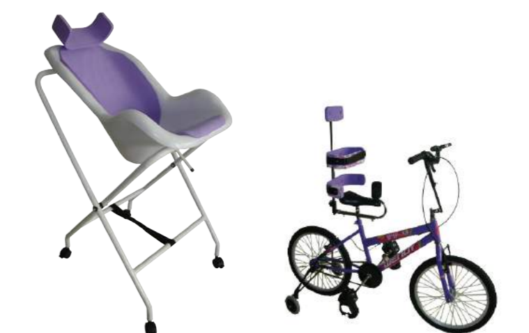
Banhita Cód: 3090001 Cores: Lilás e Azul Opcional com ou sem prolongador Bicicleta Adaptada Cód: 3100068