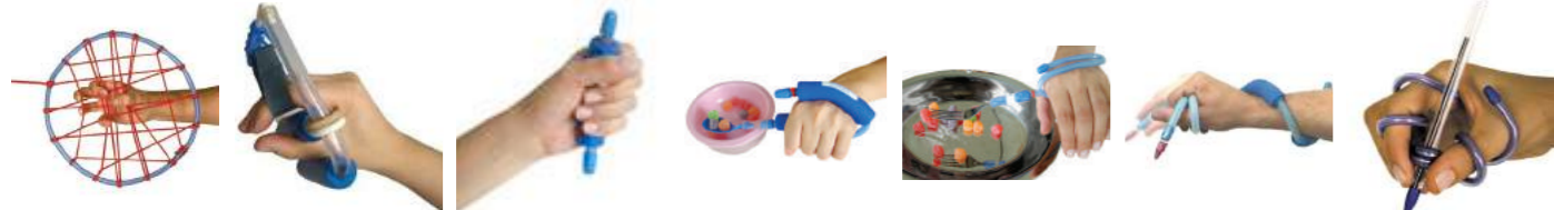
TFE3 - Exercitador elástico Cód: 3205009 TFE4 - Multiexercitador HandPlus Cód: 3205010 TFF1 - Facilitador preensão Cód: 3202001 TFF2 - Facilitador Palmar Cód: 3202004 TFF3 - Facilitador dorsal Cód: 3202007 TFF4 - Facilitador de Punho e Polegar Cód: 3202010 TFF5 - Aranha Mola Cód: 3202020