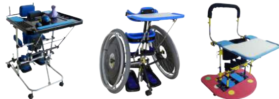
Ergotrol® Cód: EG3 Ergofax Cód: 3090013 Aquarela Parapodium Cód: 3092002