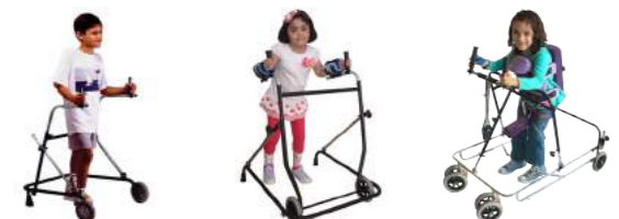
Ciclo Sul Cód: 3091028 Ciclo Norte Cód: 3091024 Transfer® Cód: 3091099