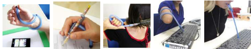
TFF6 - Arroba Cód: 3202024 TFF7 - Delta Cód: 3202025 TFF8 - Gama Cód: 3202023 TFF9 - Beta Cód: 3202031 TFF10 - Sigma Cód: 3202035

Com exceção dos modelos TFE3, TFE4 e TFF10, todos os modelos disponibilizam tamanhos variados e lado de uso. Mais informação, nos consulte.