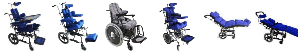
Canguru AX2® Cód: KAX-102 Canguru AX20® Cód: KAX20-102 Express Cód: 3011070 Tilt Ergoenvolvente Cód: 3023001 Transform Cód: 3023001 Leito Cód: 3023005

Anvisa: 80118040003, 80013849003, 10292019053 e 8033609 INOR: INO299/16