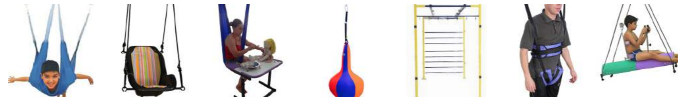
Asa Delta Cód: 3100020 Balanço Concha Cód: 3100021 Casulo Elástico Cód: 3100022 Moranga Cód: 3100120 Orbitador Cód: 3100122 Paraquedas (adulto e infantil) Cód: 3100025 Pégasus Cód: 3100026