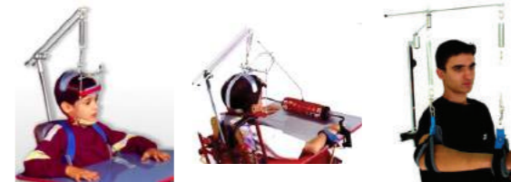
LV1 Cód: 3215022 LV2 Cód: 3215015 LV3 Cód: 3215016

São promotores de aprendizagem, socialização, motivação e autoestima.