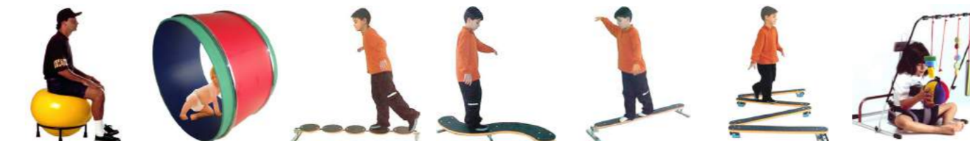
Arobal e Bancobol Cód: 3100036 Barril Cód: 3100044 Caminho Circular Cód: 3100037 Caminho Curvo Cód: 3100038 Caminho Plano Cód: 3100039 Caminho Múltiplo Cód: 3100013 Cantinho Dinâmico Cód: 3100130