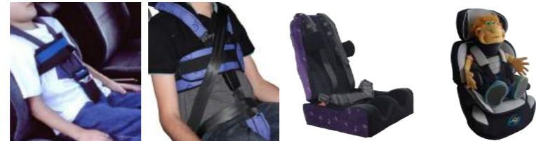
CP1 Cinto Prático Infantil Cód: 3215019 CP2 Cinto Prático Adulto Cód: 3215023 CarLev Cadeira Automotiva Cód: 30500018