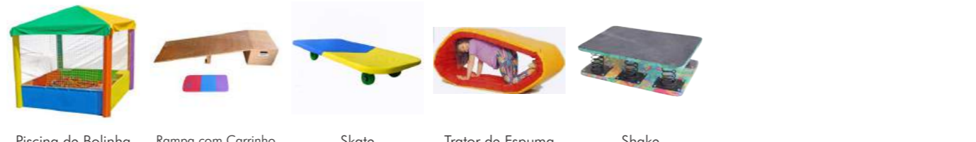
Piscina de Bolinha Cód: 3100048 Rampa com Carrinho Cód: 3100049 Skate Cód: 3100050 Trator de Espuma Cód: 3100057 Shake Cód: 3100135