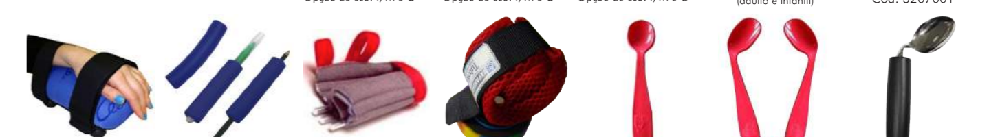
Multiluva Cód: 3201043 (adulto e infantil) OE1 Carrinho de mão curto Cód: 3207001 OE2 Carrinho de mão longo Cód: 3207002 OF1 Engrossador Cód: 3203001 OF3 Pulseira de peso Cód: 3203003 OF4 Pulseira Imantada Cód: 3203006 OF8 Colher Plástica Reto Cód: 3203010 OF9 Colher plástica curva Cód: 3203012 OF11 Colher metal curva Cód: 3203014