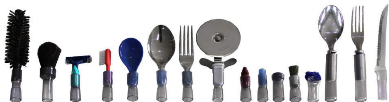
TAC 01 - Escova de cabelo TAC 02 - Pincel grande (barba, blush, pó-compacto) TAC 03 - Aparelho de barbear TAC 04 - Escova de dentes TAC 05 - Colher plástica TAC 06 - Colher de metal TAC 07 - Garfo TAC 09 - Faca circular TAC 10 - Giz de cera TAC 11 - Penteira (apontador, digitador e paginador) TAC 12 - Imã TAC 13 - Pincel pequeno TAC 14 - Adaptador universal TAC 15 - Colher Balancinho TAC 16 - Garfo balancinho TAC 17 - Faca com serra TFF Tuboform® Facilitadores Funcionais: Todos disponibilizam de ponteiras para recepção obrigatória de um dos 17 TACS (foto ao lado). Estes possuem seus respectivos modelos corretos para utilização.