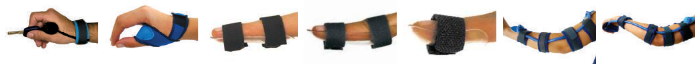
OP1 - Abdutor Dinâmico Cód: 3201001 OP2 - Abdutor de Polegar em Neoprene Cód: 3201007 OP3 - Imobilizador de dedos Cód: 3201011 OP4 - Imobilizador de dedos Cód: 3201014 OP5 - Imobilizador Distal Cód: 3201017 TFP10 - Extensor de cotovelo Cód: 3200105 TFP11 - Extensor de cotovelo com relaxador de dedos Cód: 3200110