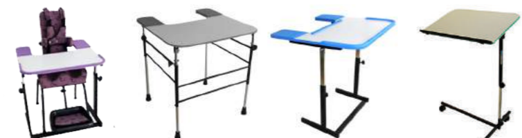
Conjunto MEC Cód: 3099001 Mesa Ergonômica Cód: 3215008 Mesa MEC Cód: 3099007 Prancheta Reclinável Cód: 3215009