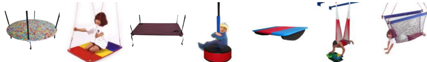
Plataforma Circular Cód: 3100027 Plataforma Pequena Cód: 3100028 Plataforma Grande Cód: 3100029 Pneu Balão Cód: 3100030 Prancha de Equilíbrio Cód: 3100014 Rede Intertela Cód: 3100032 Rede Vestibulador Cód: 3100031