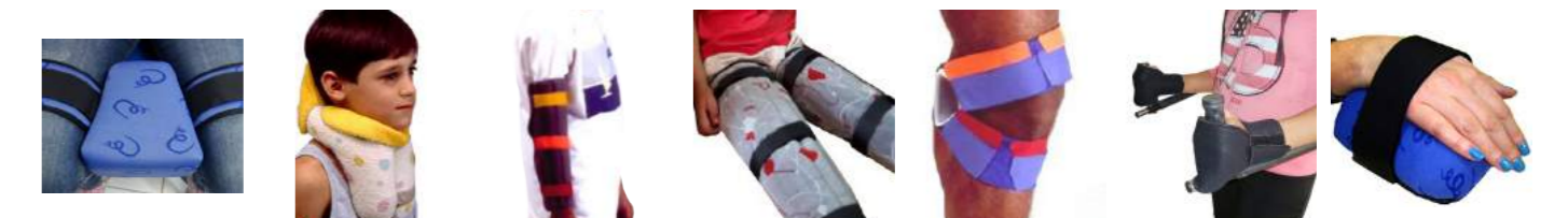
Abductor de Perna Cód: 3201025 CE1 Colar Estrutural Cód: 3215010 Extensora de braços Cód: 3201021 Opção de uso: P, M e G Extensora de pernas Cód: 3201027 Opção de uso: P, M e G Joelheira Triangular Cód: 3201030 Opção de uso: P, M e G

Equipamentos fixos e suspensos (seriados ou sob medida) para a estimulação do sistema de Integração Sensório-Motora.