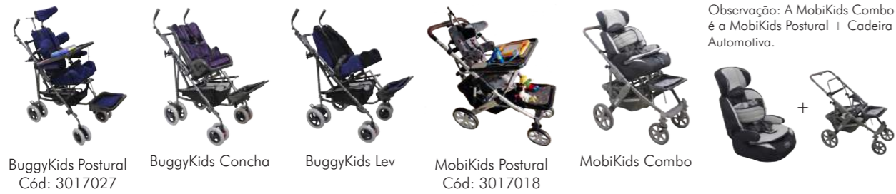
BuggyKids Postural Cód: 3017027 BuggyKids Concha Cód: 3017028 BuggyKids Lev Cód: 3017029 MobiKids Postural Cód: 3017018 MobiKids Combo

Observação: A MobiKids Combo é a MobiKids Postural + Cadeira Automotiva.