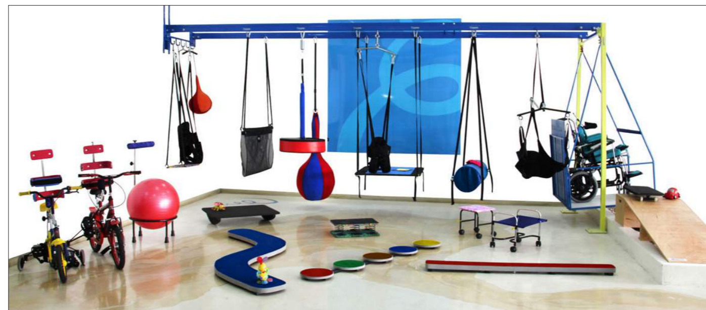
Os equipamentos e dispositivos deste catálogo estão sujeitos a possíveis alterações decorrentes de sua evolução tecnológica, sem aviso prévio. As imagens deste catálogo são meramente ilustrativas.

* Patentes deferidas, marcas registradas.